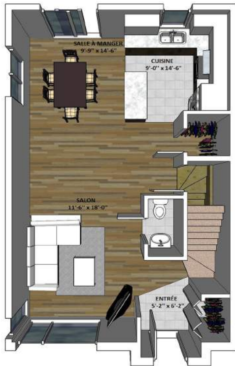
PLAN DU REZ-DE-CHAUSÉE